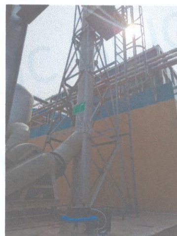
污水处理站排气筒出口 07#