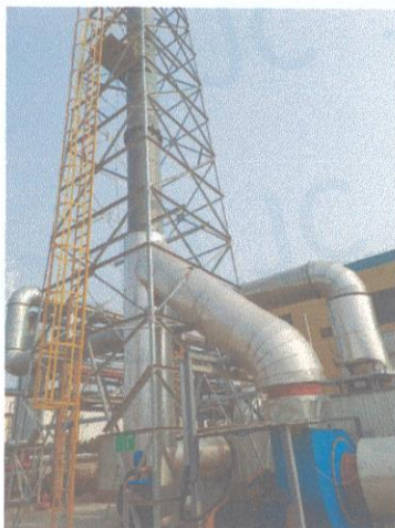
RTO 排气筒出口 06#