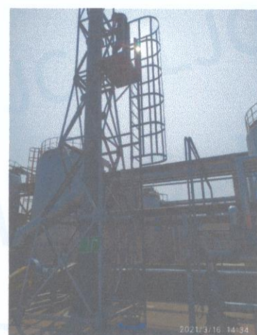
罐区一排气筒出口 05#