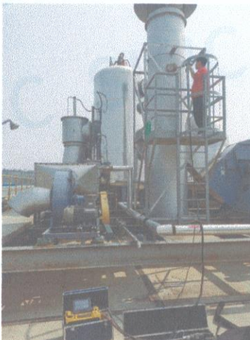
车间二排气筒出口 03#