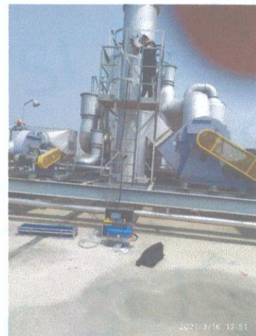
车间一排气筒出口 02#