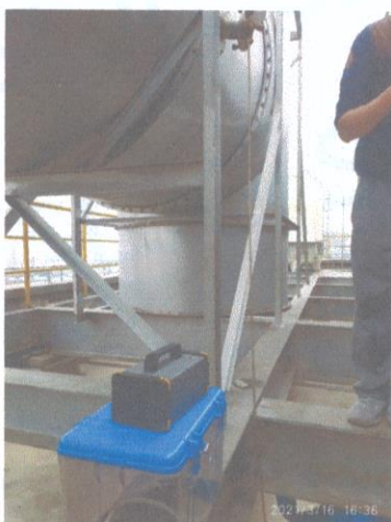
研发室排气筒出口 04#