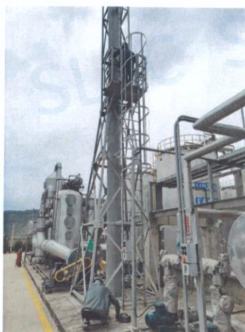
罐区一排气筒出口 04#