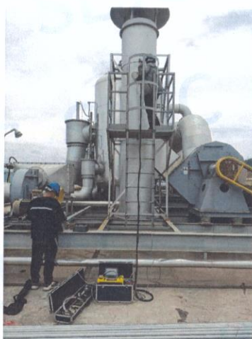
车间一排气筒出口 01#