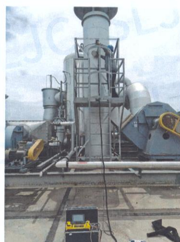
车间二排气筒出口 02#