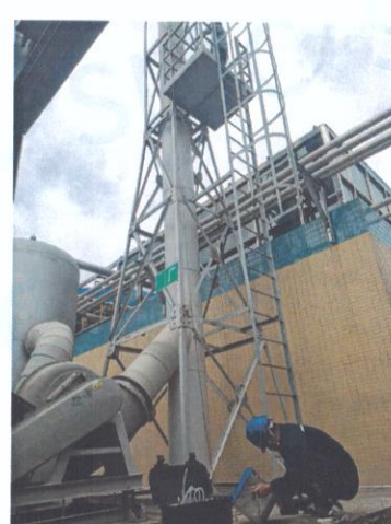
污水处理站排气筒出口 06#