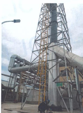
RTO 排气筒出口 05#